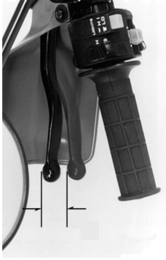
(1) Alavanca da embreagem

Os ajustes menores são obtidos através do ajustador superior posicionado junto à alavanca da embreagem.